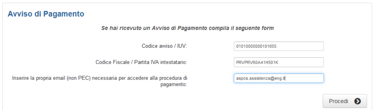
Fig. 2 – Dati Da Compilare